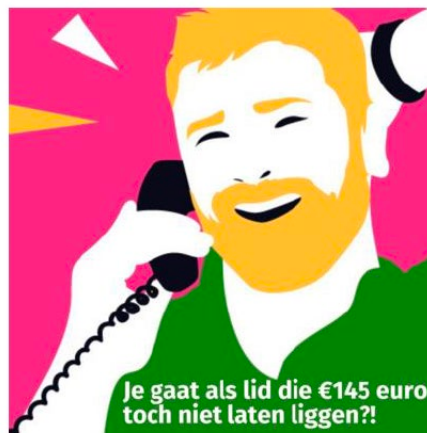
Figuur 3: illustratie gebruikt door ACV Puls op X in 2024.

De administratieve en financiële stromen zijn zo geregeld dat de vakbond zelf het aanspreekpunt is van de werknemer. De vakbond is de tussenschakel om de anonimiteit van het lidmaatschap te waarborgen. Dit vakbond keert het voordeel uit aan zijn aangeslotenen. In de ogen van de begunstigen is de premie een cadeau of cash back van de vakbond. Nergens krijgt hij te lezen dat de werkgever het voordeel financiert. Ik ken ook geen enkele werkgever die aan zijn werknemers mededeelt dat hij de syndicale premies spijs.